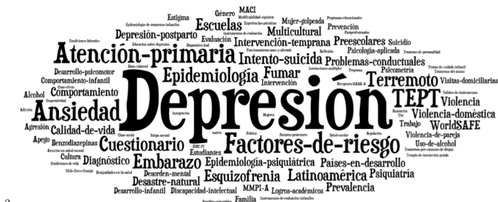
Figura 2: Nube de palabras claves de los artículos seleccionados